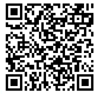
QR CODE กำหนดการ